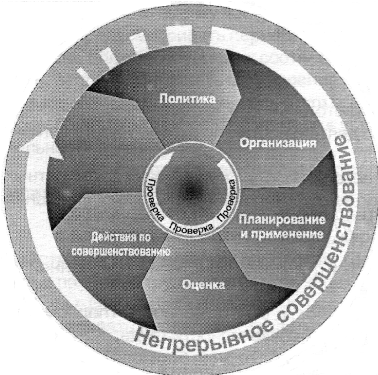
Рисунок 2 — Основные элементы системы управления охраной труда